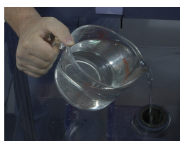
Ρίξτε τουλάχιστον ½ λίτρο κρύο νερό και αφήστε να δράσει για μερικά λεπτά.