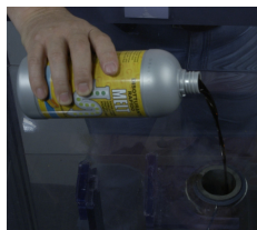
Ρίξτε (καλύτερα με πλαστικό χωνί) αργά το προϊόν