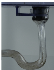
Αφήστε να τρέξει αρκετό κρύο νερό