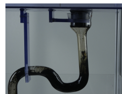
Αφήστε να δράσει για ½ λεπτό.